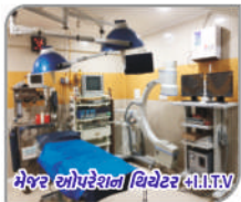
મેજર ઓપરેશન થિયેટર M.I.T.V