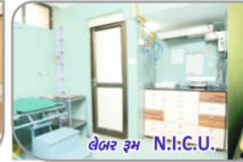
લેબર રૂમ N:I:C.U. કલર ડોલર