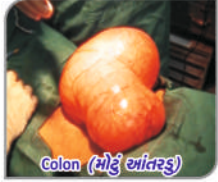
Colon (મોડું આંતરડું)