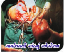
ગર્ભાશયની ગાંઠનું ઓપરેશન

સિદ્ધાર્થ કોમ્પ્લેક્સ, પાલડી પોસ્ટ ઓફિસની પાસે, નિલકંઠ પ્લાઝાની બાજુમાં, ભણ, પાલડી, અમદાવાદ-૩૮૦૦૦૭. ફોન નં: ઠો. ૦૭૯-૨૬૬૩૨૨૪૧ For Appointment: 7984219904